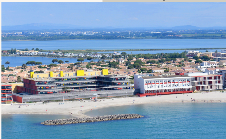
Palavas-les-Flots (34), siège de la Fondation Saint-Pierre

La Fondation Saint-Pierre déploie ce dispositif innovant sur 2 lieux de vie , à savoir Palavas-les-Flots, station balnéaire qui borde la mer Méditerranée (34) et Notre Dame de La Gardiolle, domaine au cœur de la nature, dans le magnifique Piémont cévenol (Conqueyrac 30).