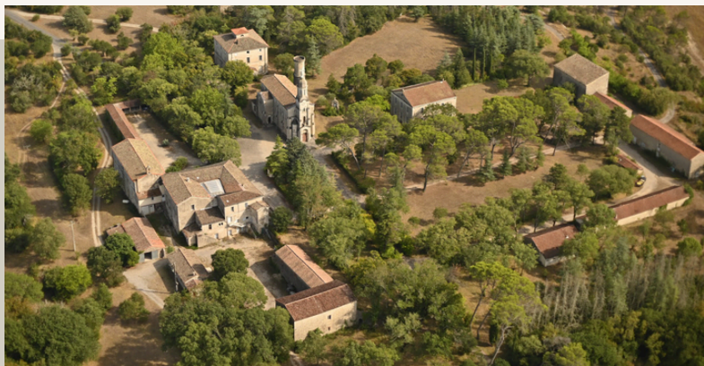
Notre Dame de la Gardiolle (30)